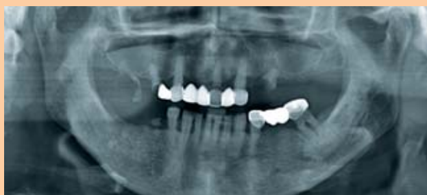
Abb. 1: Röntgenbild der Ausgangssituation mit zahlreichen extraktionswürdigen Zähnen.