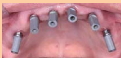
Abb. 6: Für den Intraoralscan wurden alle Implantate mit Scanbodies versehen.