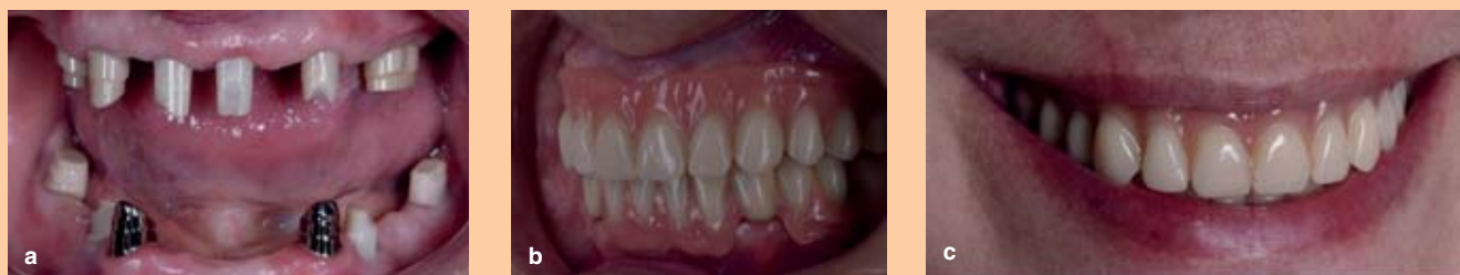
Abb. 10a–c: Die klinische Situation zu Behandlungsende mit den final zementierten Primärkronen bzw. komplett mit der Tertiärkonstruktion.