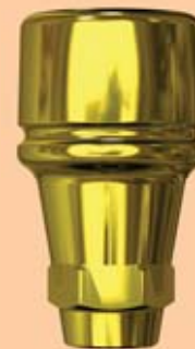
Abb. 5: Die verwendeten Shuttles erlaubten in ihrer Doppelfunktion (chirurgische Verschlusschraube und Gingivaformer) den Verzicht auf eine traumatische Freilegung.