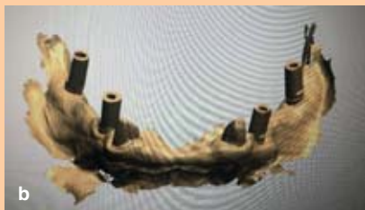
Abb. 7a/b: Der Intraoralscan diente zunächst als Basis für die Konstruktion von Primärkronen aus Zirkonoxid (für die Implantate) bzw. aus Nichtedelmetall (für die beiden natürlichen Zähne).