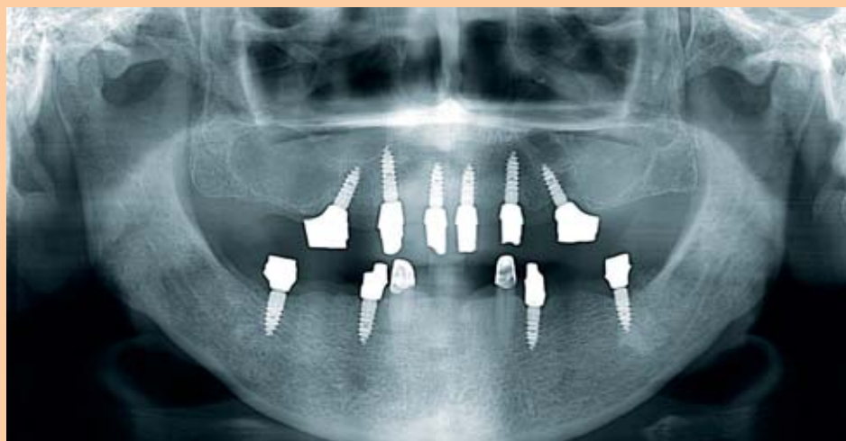
Abb. 11: Das Abschlussröntgenbild zeigt: Selbst in schwierig erscheinenden Fällen ist eine sichere Implantation möglich, wobei der Schlüssel zum Erfolg in der konsequenten Bevorzugung minimalinvasiver Verfahren liegt.

eine maximale Ausnutzung des Knochenangebots unter Berücksichtigung der über Jahre entstandenen Kieferkamatrophie und erübrigten einen beidseitigen Sinuslift (Abb. 11).