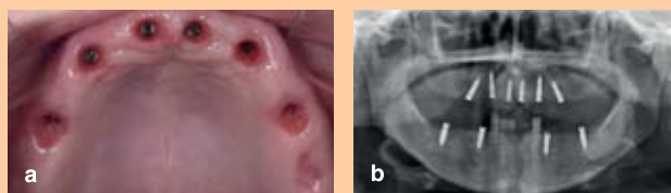
Abb. 4a/b: Für die geplante Versorgung mit Teleskopprothesen im Ober- wie im Unterkiefer wurden zehn Implantate inseriert.

Abb. 5: Die verwendeten Shuttles erlaubten in ihrer Doppelfunktion (chirurgische Verschlusschraube und Gingivaformer) den Verzicht auf eine traumatische Freilegung.