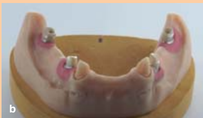
Abb. 8a/b: Die Zirkoniumdioxid-Primärkronen auf dem Modell: Sie wurden aus der Zirkon Ronden gefräst und auf Titanbasen einzementiert.